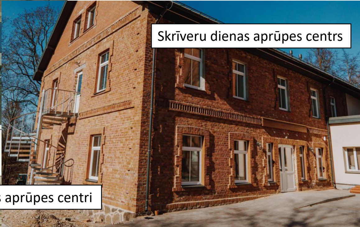
Skrīveru dienas aprūpes centrs