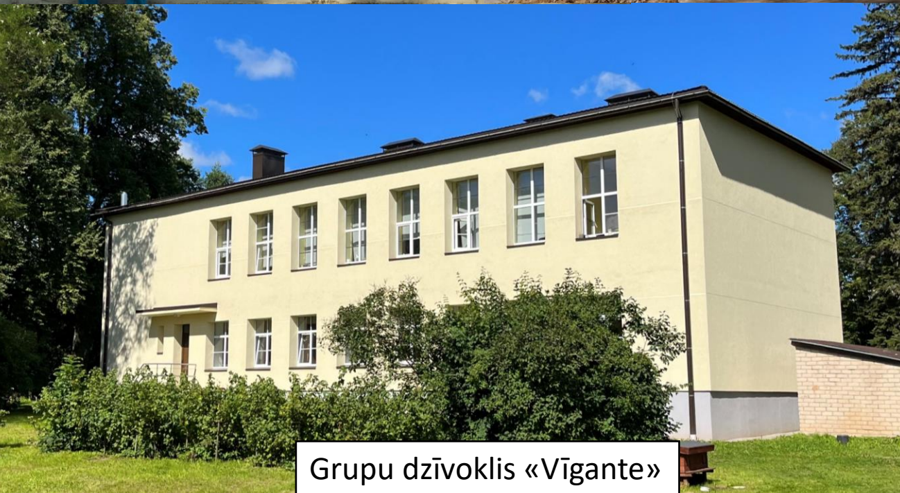
Grupu dzīvoklis «Vīgante»