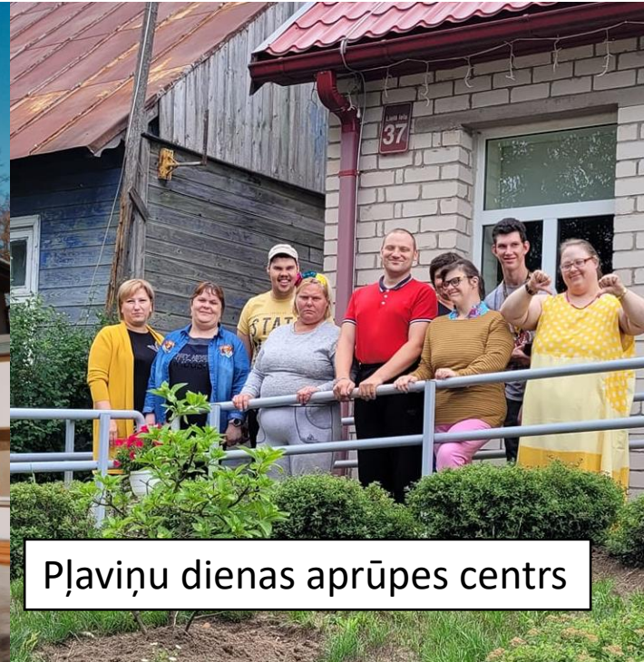
Pļaviņu dienas aprūpes centrs