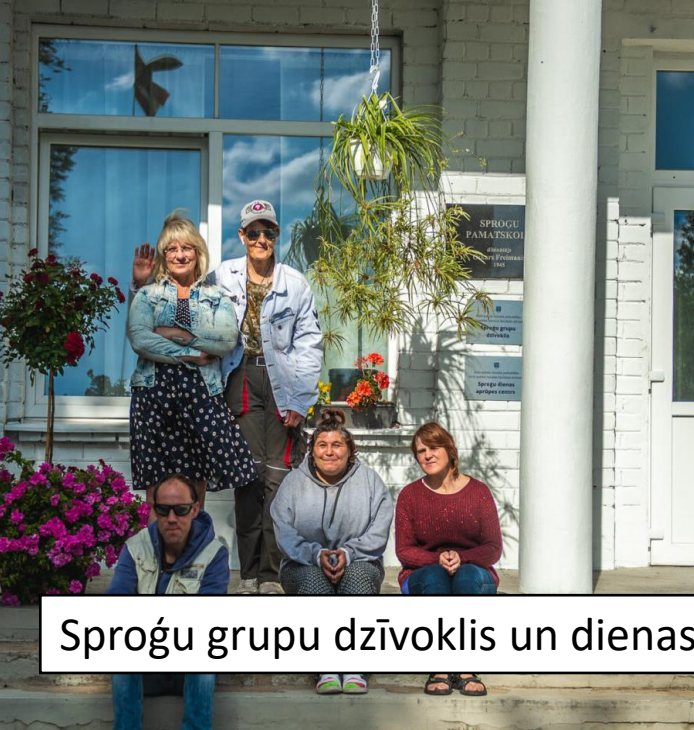
Sproģu grupu dzīvoklis un dienas aprūpes centri