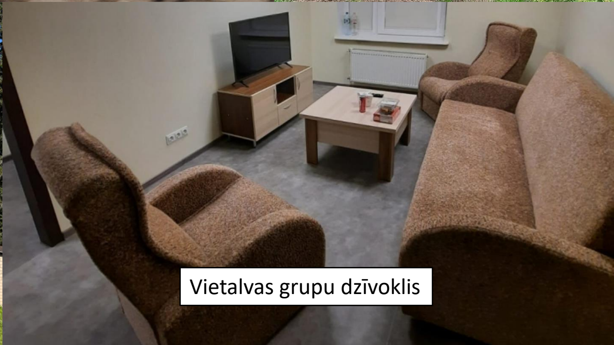
Vietalvas grupu dzīvoklis